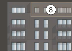
HAUS TROMBA 7.1