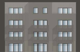
HAUS FAGATTO 7.2