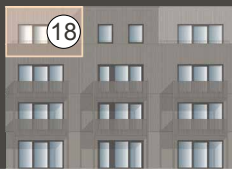
HAUS FAGATTO 7.2