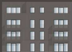
HAUS TROMBA 7.1