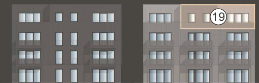
HAUS TROMBA 7.1