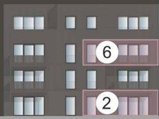
HAUS TROMBA 7.1