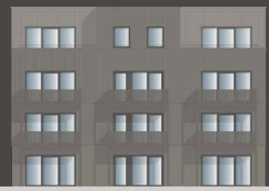
HAUS FAGATTO 7.2