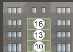
HAUS FAGATTO 7.2