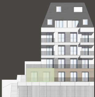
Ansicht von Nordwesten (Gartenseite)