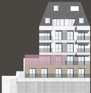
Ansicht von Nordwesten (Gartenseite)