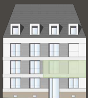
Ansicht von Südosten (Straßenseite)